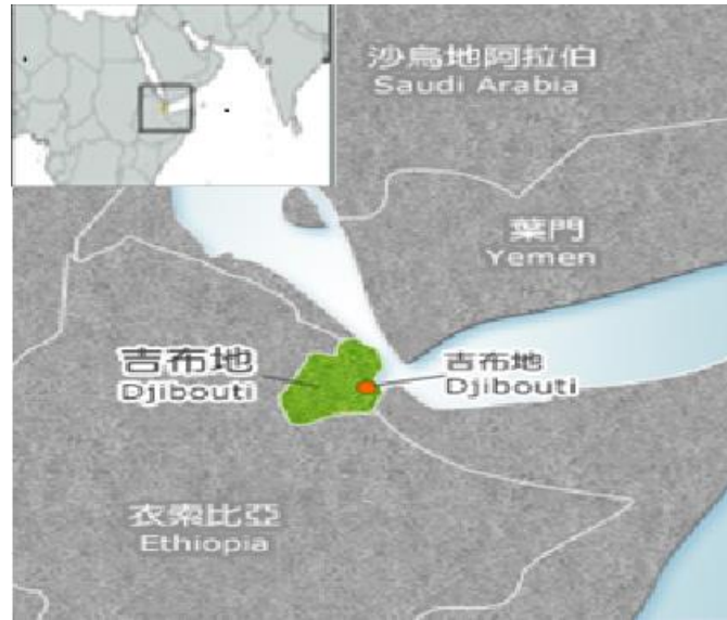
圖 2、吉布地之地理位置圖