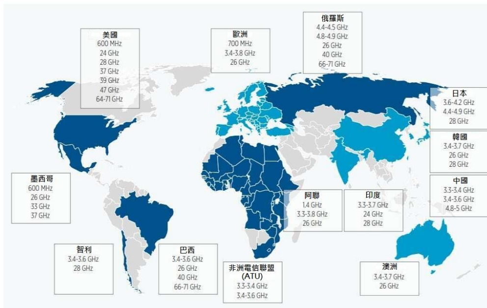
圖 2、全球主要國家區域 5G 頻段

「次 6 吉赫」頻段技術對於已經掌握 4G LTE 技術的國家以及開發中國家來說，升級門檻相對較低，因此發展速度較快。「毫米波」頻段過去只有雷達與衛星使用，頻寬潛力較大，惟開發成本較高，相關設備發展現以美國為主(圖 2)。