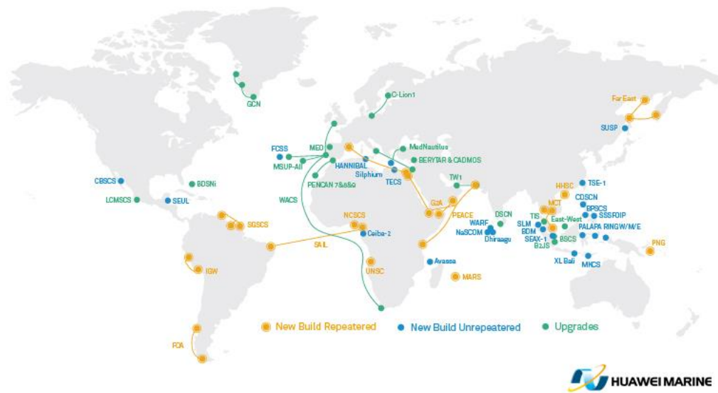
圖二、華為海洋全球海纜計畫分布

類似建置的還有非洲側由安哥拉上陸、由 NEC 承包的南大西洋海纜系統 (South Atlantic Cable System, SACS)，短期內非洲與南美洲間訊務成長幅度應無海纜建置需求。智利案的挫敗，使華為海洋欲透過南太平洋島嶼設立跨洋海纜節點的計畫落空，缺乏關鍵節點亦讓其未來不易參與類似海纜計畫。