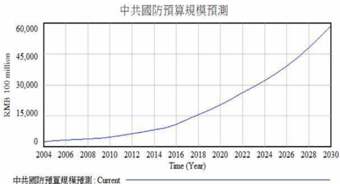
圖 2、中共國防預算規模趨勢預測圖

本模型參考之數據來源如表 2 所述進行概估。首先進行中共國防預算規模趨勢之模擬結果說明，圖 2 結果說明中共國防預算受 GDP 成長率、統計績效指標及永續發展指標之影響，其編列數大於決算數，國防預算額度呈穩定增加趨勢。研究結果呈現 2030 年中共國防預算編列數規模將達到 39,030 億元人民幣，決算數規模達到 32,880 億元人民幣。惟此結果乃依據當前全球經濟環境發展規劃條件進行，不受重大天災、疫情及國家變故之影響。