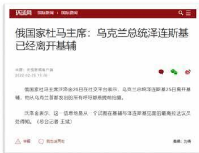
圖 2、中俄官媒發佈假訊息案例

息聯盟」(alliance for disinformation)來形容。 13 俄烏戰爭更促使雙方宣傳論點進一步靠攏，例如《央視網》等官媒2月26日即協助散佈「俄國家杜馬主席：烏克蘭總統澤連斯基已經離開基輔」之假訊息(如圖2)。俄羅斯駐英大使館3月推文稱，發現資料顯示由美國國防部資助的烏克蘭實驗室製造生化武器。此類假訊息獲中國外交部回應，「美國在烏克蘭境內開展大量生物軍事活動」， 14 《人民網》、《新華網》也不斷附和俄「陰謀論」攻勢； 15 中國官媒也對俄羅斯指控烏克蘭自導自演在布查(Bucha)屠殺、克拉馬托爾斯克(Kramatorsk)火車站空襲等報導， 16 顯見兩國在宣傳的合作。