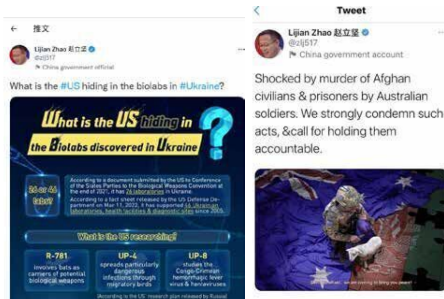
圖 1、中國官員推特的假訊息案例

資料來源：Lijian Zhao, “What is the US Hiding in...,” Twitter , March 18, 2022, https://twitter.com/zlj517/status/1504769988775006208?lang=zh-Hant ; Lijian Zhao, “Shocked by Murder of Afghan...,” Twitter , November 30, 2020.