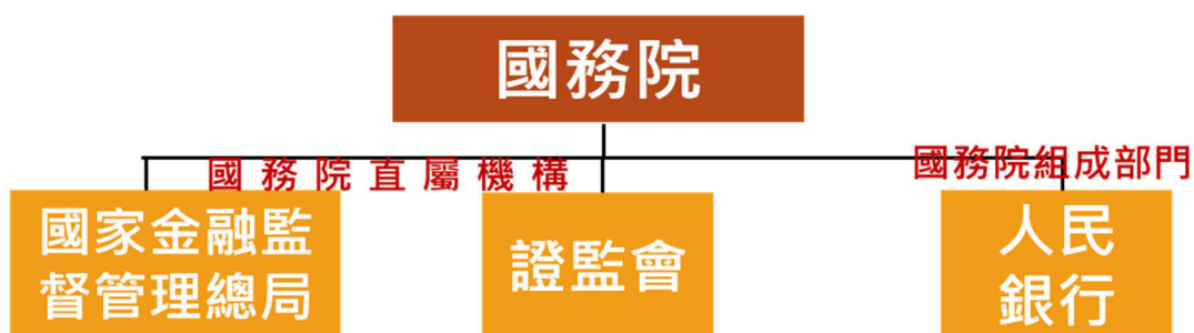
圖 1、中國金融監管體制演變：2003 年至今